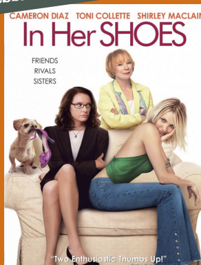
"In her shoes" di Curtis Hanson